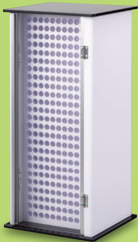
NT-500 (2面回転タイプ) サイズ: W210×D168×H480mm 標準希望小売価格 42,000円(税込)