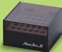
NB-30 サイズ: W115×D123×H69mm 標準希望小売価格 3,360円(税込)