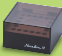
NB-18 (朱肉置付) サイズ: W115×D123×H69mm 標準希望小売価格 3,360円(税込)