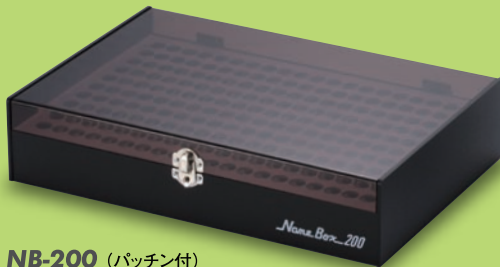
NB-200 (パッチン付) サイズ: W316×D220×H69mm 標準希望小売価格 11,550円(税込)