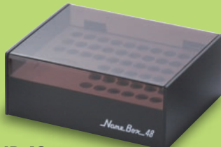
NB-48 (朱肉置付) サイズ: W175×D143×H69mm 標準希望小売価格 5,460円(税込)