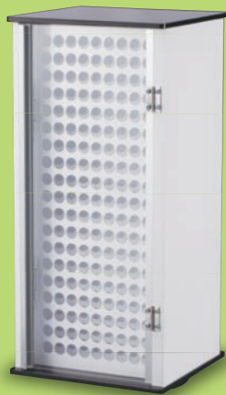
NT-300 (2面回転タイプ) サイズ: W175×D168×H385mm 標準希望小売価格 36,750円(税込)