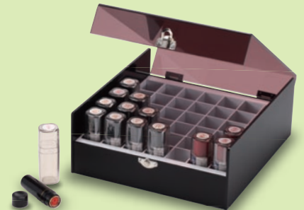
NBS-42 (パッチン付) サイズ: W175×D143×H69mm 標準希望小売価格 9,450円(税込)