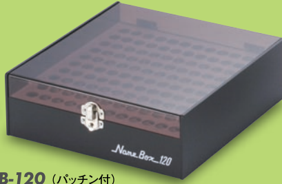
NB-120 (パッチン付) サイズ: W205×D228×H69mm 標準希望小売価格 8,400円(税込)