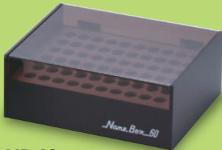
NB-60 サイズ: W175×D143×H69mm 標準希望小売価格 5,460円(税込)